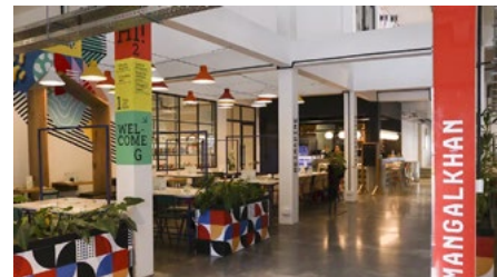
Evolis Properties a donné un second souffle à l'ancienne usine de Floréal Knitwear, située à Mangalkhan.

Evolis Properties se spécialise dans la valorisation et la réhabilitation des bâtiments industriels. Filiale du Groupe CIEL, l'entreprise concentre ses efforts sur la régénération, l'adaptabilité et la durabilité de l'immobilier. Le portfolio d'Evolis compte aujourd'hui six bâtiments, dont certains étaient utilisés par CIEL Textile, et sont désormais transformés en espaces modernes et responsables.