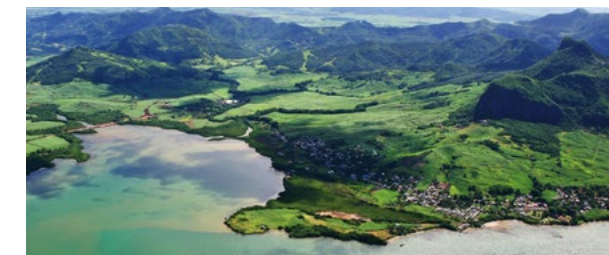
Le CIEL Sustainable Finance Framework permet le financement des projets ayant un impact environnemental et social.

Favoriser une main-d'œuvre dynamique, promouvoir une croissance inclusive et soutenir une action environnementale résolue. Ce sont les trois piliers de la stratégie 2020-2030 du Groupe CIEL. Pour atteindre ses objectifs et ses ambitions, le Groupe a conçu un cadre financier novateur : le CIEL Sustainable Finance Framework. Il permet de structurer et d'orienter le financement des projets environnementaux, sociaux et de gouvernance. Cette initiative s'inscrit pleinement dans la stratégie globale de développement durable du Groupe, alignée avec les Objectifs de développement durable (ODD).