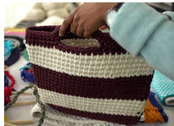
En pleine confection, une pochette issue du projet Wealth Out of Waste, à travers lequel CIEL Textile redonne vie aux déchets textiles en les transformant en produits utiles et décoratifs.