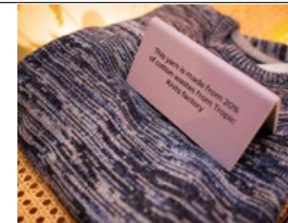
Un fil responsable : ce vêtement a été tricoté à partir d'un fil contenant 20% de coton recyclé, issu des déchets textiles de Tropic, filiale du Groupe CIEL Textile.