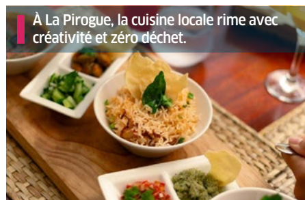
À La Pirogue, la cuisine locale rime avec créativité et zéro déchet.